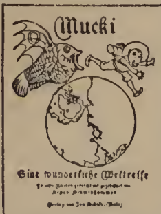
Eine wunderliche Weltreise Gezeichnet von Arpad Schmidhammer Gedruckt von J. B. Metzger, Berlin

Format 31×23 cm Mk. 3.—, unzerreißbar auf Pappe » 3.50.